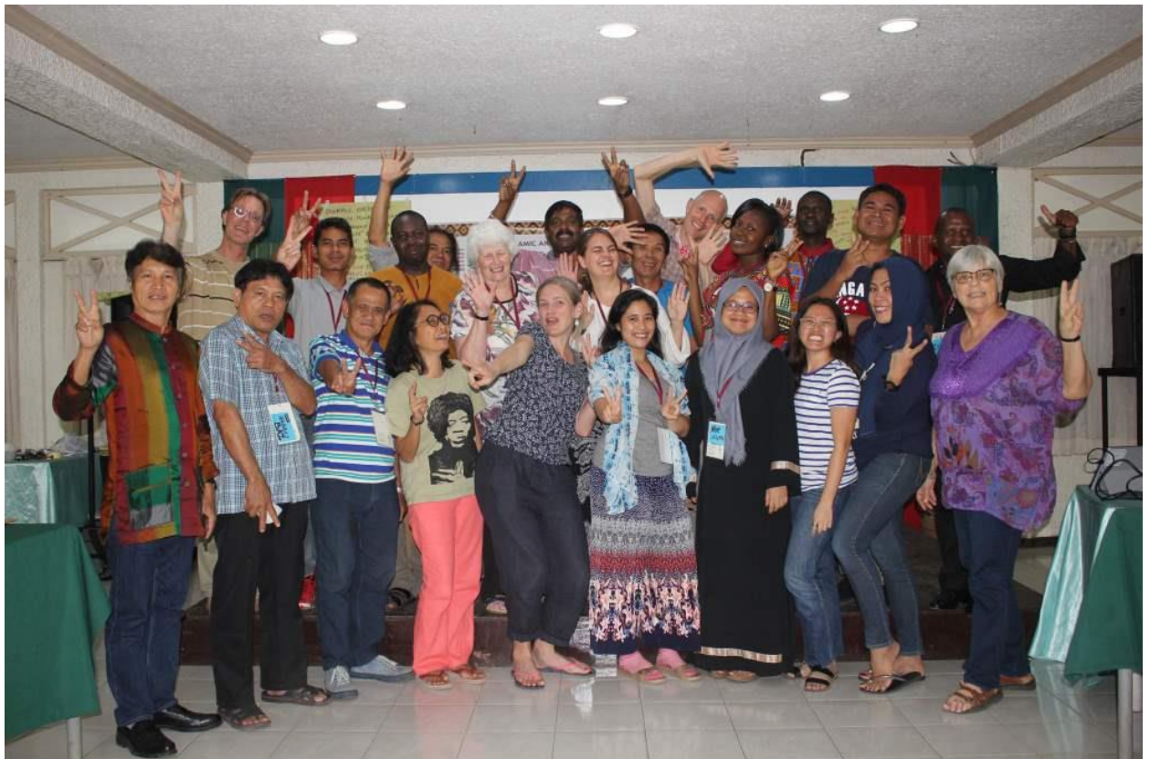
Mindanao, Filipijnen – Eerste Interfaith Peacebuilding Training